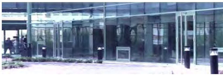
CRNK de Bordeaux

Comme vous le savez, le kératocône est une maladie rare (la plus fréquente des maladies rares : 1 cas sur 2.000) et nous avons la chance d'avoir un centre de référence national (CRNK Bordeaux/Toulouse). Ce n'est pas automatique pour toutes les maladies rares. Seules certaines maladies ont été sélectionnées. Bien entendu, la HAS a privilégié les pathologies qui étaient soutenues par des associations. Vous en êtes donc tous un peu les promoteurs.